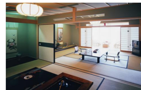
◇和室(和室2間続き 10畳+6畳)