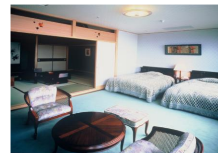
◇和洋室(12.5畳+ツインベッド)