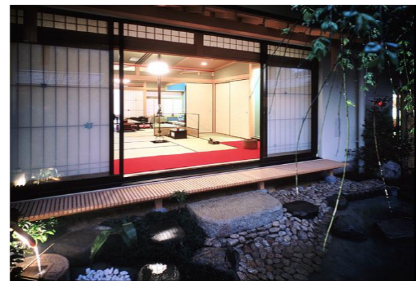
◇特別室(和室3間続き)

贅を尽くした極上の和のなごみと眺望のプレミアムステージ。長崎でのステータスとして、ゆとりのご滞在を満喫してください。